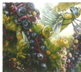
F130号『とどめてもなおあふれてくる』